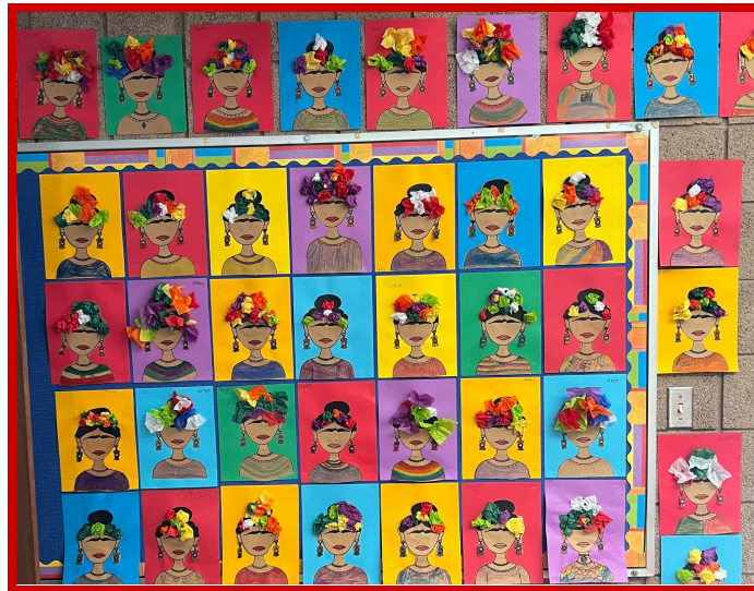
3rd Grade "Freda Kahlo" Portrait / Retrato de "Frida Kahlo" de tercer grado

During Hispanic History Month our 3rd grade students learned about Hispanic Culture and Art. / Durante el Mes de la Historia Hispana, nuestros estudiantes de 3er grado aprendieron sobre la cultura y el arte hispanos.